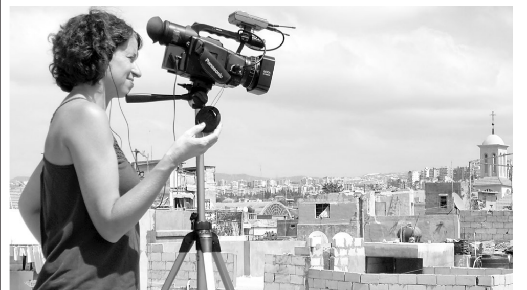
Dans les rues et sur les toits, la cinéaste capte et fixe le temps.